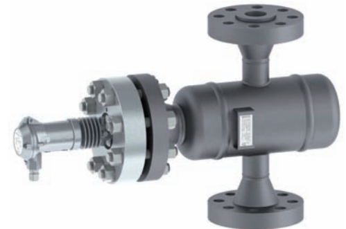
Trimod Besta Füllstandscharter Typ: HAA 22C01 041 Trimod Besta Schwimmerkammer Typ: I021-1C0RC1