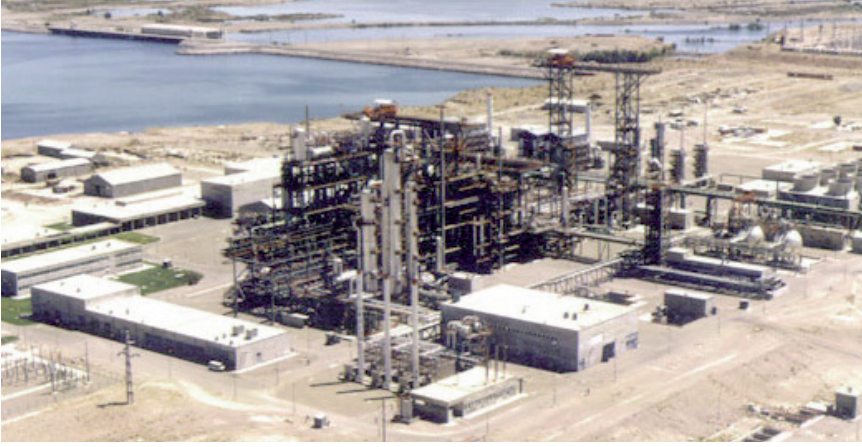
Arroyito Nükleer Enerji Santrallerinde ağır su üretimi, Arjantin

Bachofen OEM ve tesis inşaatçılarına dolun seviyesi limit şalteriyle ilgili kapsamlı bir program sunmaktadır. Kapasitif dolun seviyesi limit şalterleri ve transmiyeri teklifimizi tamamlamaktadır ve böylece tüm hizmetleri tek bir elden sunmuş olmaktadır.