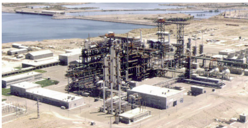
Arroyito 重水製造用プラント アルゼンチン

Bachofen は、OEM 向け及び各種設備用レベルスイッチの広範なプログラムを用意しています。さらに弊社はコンデンサスイッチ並びにレベルインジケータ、レベルトランスミッター取り揃え、製品提供内容を完璧に整え、皆様のあらゆるご要望にお応えできる体制でいます。